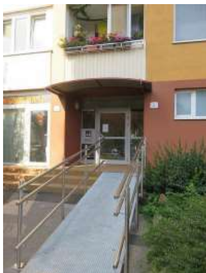
Hlavný vchod do domu