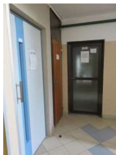
Spoločné priestory na prízemí/ 1.NP