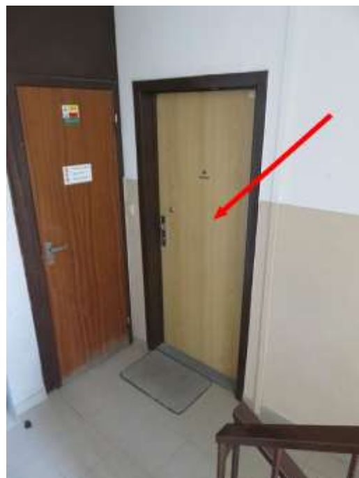
Dvere bytu č.14/1.posch.