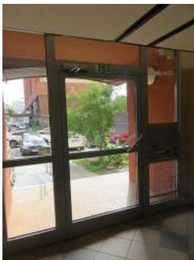
Zádverie hlavného vchodu