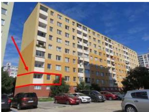
Východný pohľad na bytový dom