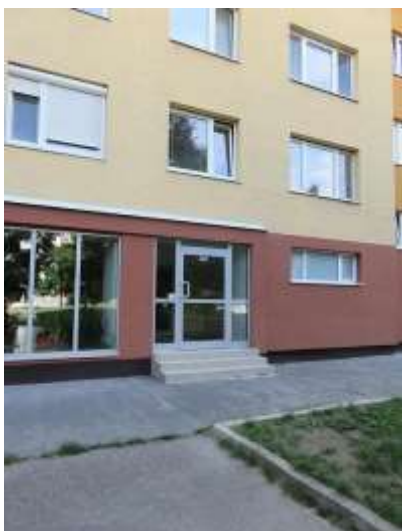
Zadný vchod domu